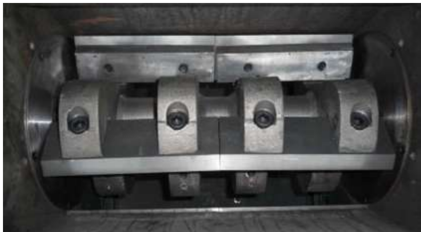
Ножи подвижные / не подвижные для роторной дробилки и агломератора