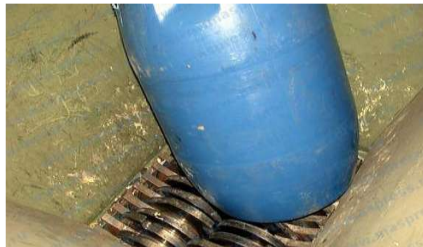
Фрезы для шредерной дробилки